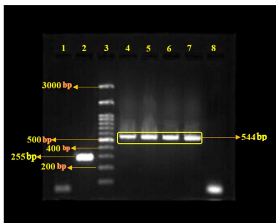
شکل ۱: تکثیر ژن Tax در برخی از نمونه‌ها. ستون ۱: کنترل منفی، ستون ۲: ژن GAPDH (۲۵۵bp)، ستون ۳: لدر ۳kb، ستون ۴: کنترل مثبت (۵۴۴bp)، ستون ۵-۷: نمونه مثبت (۵۴۴bp)، ستون ۸: کنترل منفی

بعد از انجام واکنش زنجیره‌ای پلیمرز آشیانه‌ای برای نمونه‌های بافت پارافینه پستان و خون، محصولات بر روی ژل آگارز ۱/۵٪ ران شدند. نمونه‌هایی که باند ۵۴۴ bp برای ژن Tax داشتند به عنوان نمونه Tax+ (مثبت برای ژن Tax) شناخته شدند (شکل ۱).